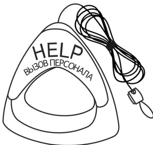
Рисунок 2. Дополнительная ручка со шнуром для кнопок вызова MP-060W1

При использовании кнопки вызова в душевой для МГН может понадобиться добавление к ней второго захвата. Для этого используется дополнительная ручка красного цвета со шнуром красного цвета для кнопок вызова MP-060W1. Длина шнура - 1 м. Внешний вид дополнительной ручки со шнуром для кнопок вызова приведен на рис.2.