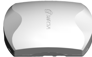
Рисунок 1. Внешний вид прибора

Прибор изготовлен в пластмассовом корпусе (рисунок 1).