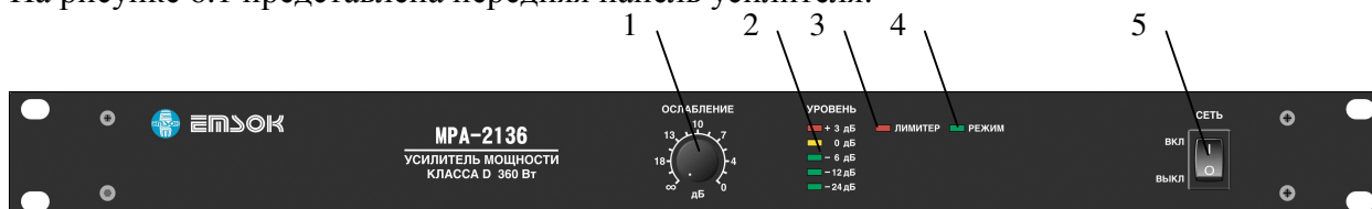
Рисунок 6.1. Передняя панель усилителя. 1 – Регулятор громкости, 2 – индикатор уровня, 3 – индикатор перегрузки, 4 – индикатор режима работы, 5 – выключатель питания.

На рисунке 6.1 представлена передняя панель усилителя: