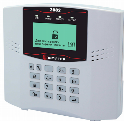
Рисунок 1. Внешний вид прибора

Прибор изготовлен в пластмассовом корпусе, с клавиатурой и ЖК-экраном (рисунок 1).