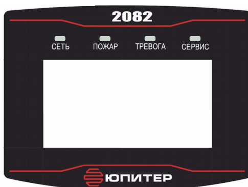
Рисунок 3. Внешний вид панели индикации

На лицевой панели прибора расположены жидкокристаллический дисплей и светодиодные индикаторы (рисунок 3), режимы работы светодиодных индикаторов описаны в таблице 2.