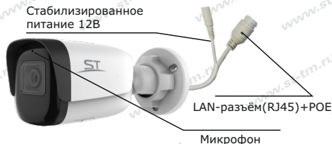
Рис.1 Схема подключения видеокмеры