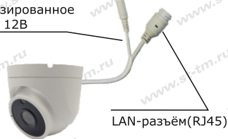
Рис. 1 Схема подключения видеокамеры