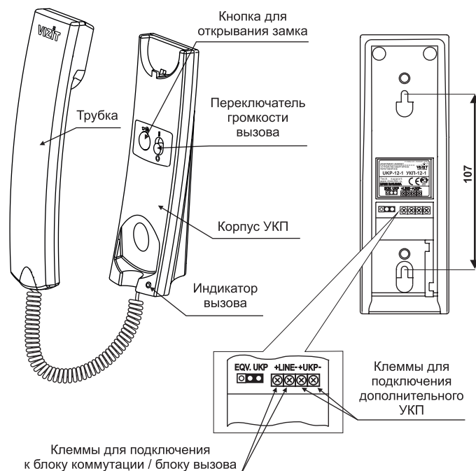
Рисунок 1 - Расположение органов управления и установочный размер