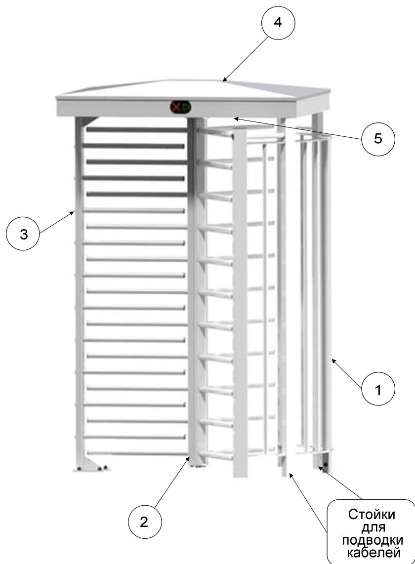
Рис. 1. Общий вид турникета.