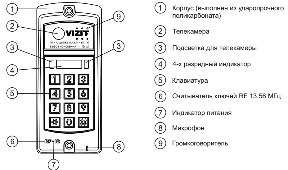
Рисунок 1 - Внешний вид блока

Блок вызова домофона БВД-317FCBW (в дальнейшем - блок вызова) используется совместно с блоками управления БУД-302М, БУД-302S, БУД-302К-20, БУД-302К-80, БУД-302S-20, БУД-302S-80, БУД-430, БУД-430М, БУД-430S, БУД-485, БУД-485М и БУД-485Р как составная часть многоквартирных домофонов и видеодомофонов VIZIT (серии 300, 400).